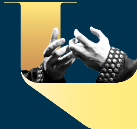
La battaglia di Legnano