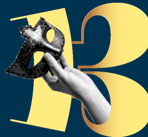
Un ballo in maschera